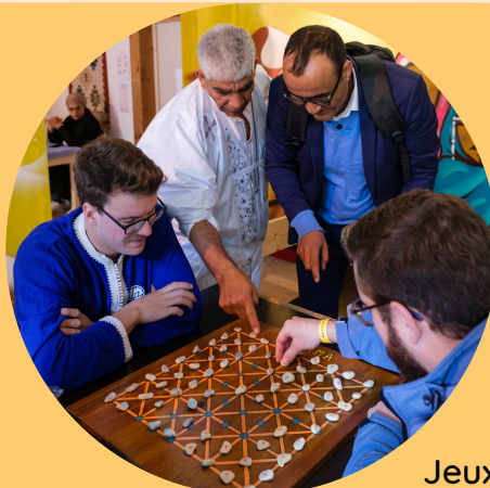
Jeux de société d'Afrique du Nord 19 novembre 2022 - La Voie des Peuples #5

La Voie des peuples Japonais prendra vie à l'espace Jean Vautrin du parc de Mussonville à Bègles. Comme toujours, cette édition de la Voie des Peuples sera réalisée avec les structures culturelles de la région qui promeuvent la culture Japonaise : l'association franco-japonaise Rivages, l'association Matsukazé ou le collectif étudiant Oyashima - 大八島 pour ne citer que ces trois-là. L'immense culture du Japon et sa diversité sera mise à l'honneur à travers deux projections de films, des ateliers traditionnels (cérémonie du thé, shibori, origami, aikido...), des présentations de mangas, des spectacles de danse (Yosakoi, Buto) et des repas partagés mettant en valeur la gastronomie Japonaise.