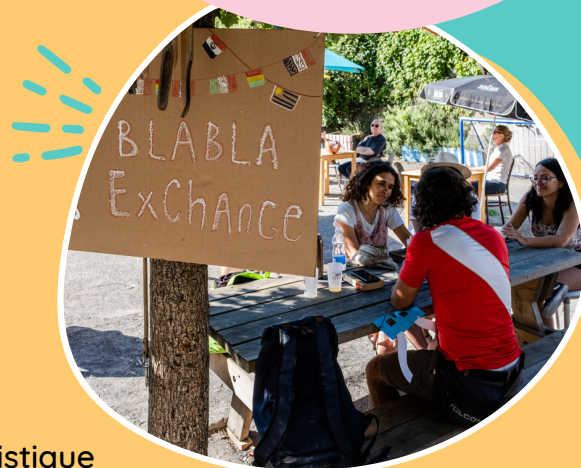
BlaBla Exchange Atelier interlinguistique 29 mai 2022, la Voie des Peuples #3

Après un an et demi d'existence, l'association la Pangée compte plus de 2000 adhérent.e.s et l'équipe n'a jamais eu autant de projets dans ses valises. Nous avons prévu d'organiser deux éditions de la Voie des Peuples en 2023.