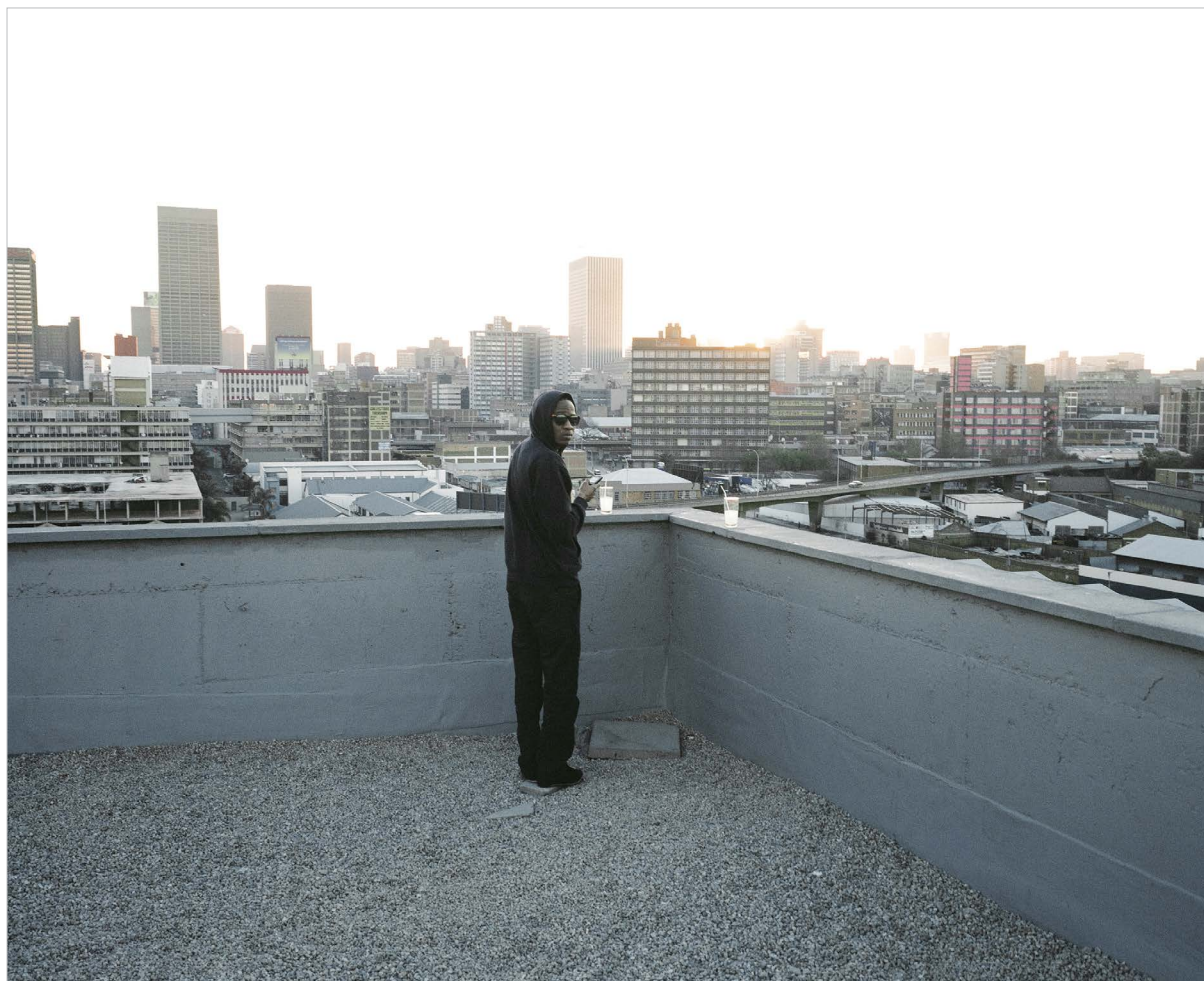
Johannesburg. Un participant d'une fête « hype » sur le toit d'un immeuble du Central Business District (CBD).