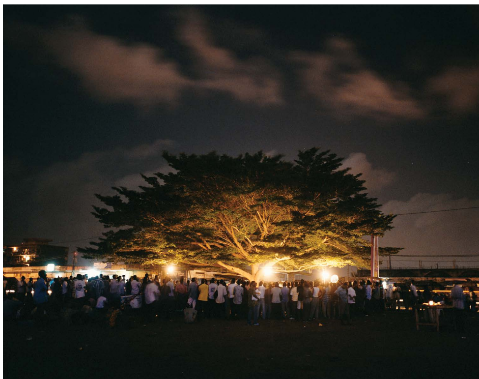
Côte d'Ivoire. Un meeting politique en plein air dans le quartier de Markoury, à Abidjan.